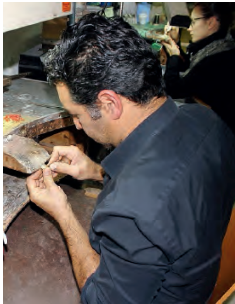
INCENTIVI PER I GIOVANI CHE RESTANO AL SUD

Il progetto. Incentivi fiscali per i giovani da 18 a 35 anni che restano al Sud