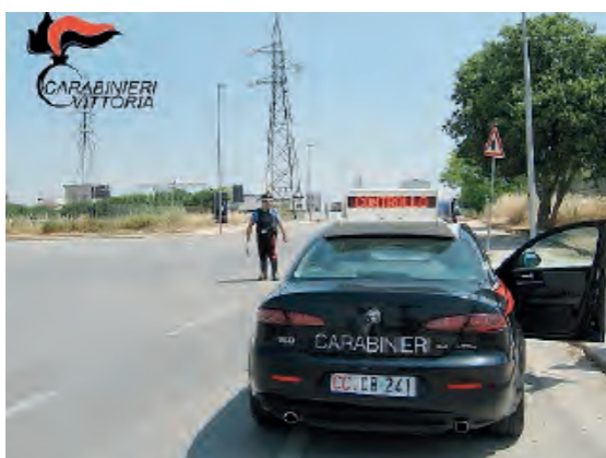
CONTROLLI A TUTTO CAMPO DA PARTE DEI CARABINIERI

Vittoria, Comiso, Chiaramonte Gulfi e Acate, i 4 Comuni ipparini al centro dell'attenzione dei carabinieri lo scorso fine settimana: un arresto e 3 denunce per reati legati allo spaccio di stupefacenti. I militari dell'Arma coordinati dal capitano Giancarlo Pallotta, hanno eseguito decine di perquisizioni locali e personali, nonché identificate numerose persone allestendo posti di controllo lungo le principali vie di comunicazione.