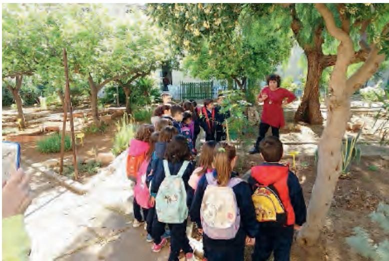
LA VISITA DELLO SCORSO ANNO NELL'ORTO DEI CAPPUCCINI

Il progetto si pone quale punto di riferimento per la conoscenza delle erbe medicinali, attraverso percorsi naturalistici guidati che permettono di acquisire l'antica scienza delle arti officinali e di conoscere ed apprezzare svariate specie di piante da frutto, ma non solo. Un'occasione da non perdere e soprattutto da non far perdere ai nostri ragazzi che sco-