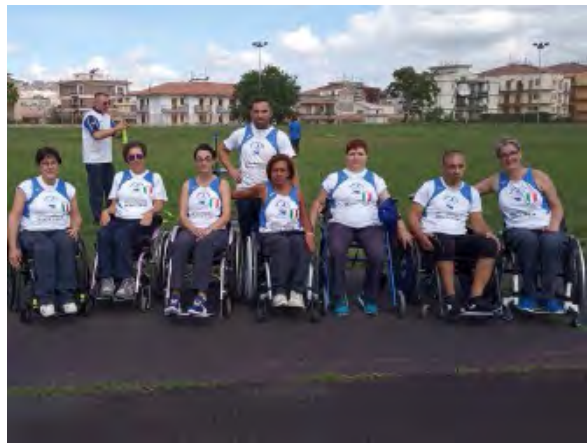
COPPA ITALIA LANCI: I FORMIDABILI ATLETI PARALIMPICI DELLA HANDY SPORT RAGUSA