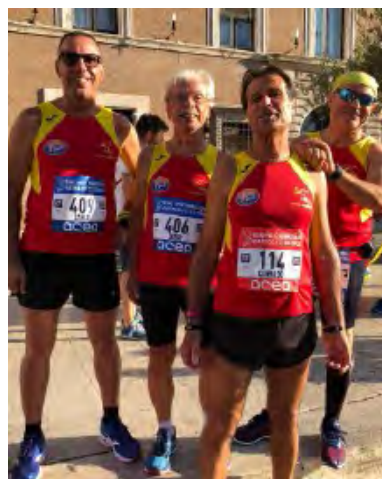
I FONDISTI DELL'ISPICA RUNNING A ROMA