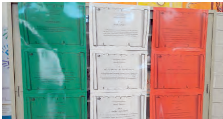
L'INIZIO DELL'ANNO SCOLASTICO ALL'ISTITUTO SAN BIAGIO