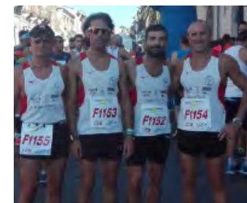
L'ULTRARUNNING A PIEDIMONTE ETNEO