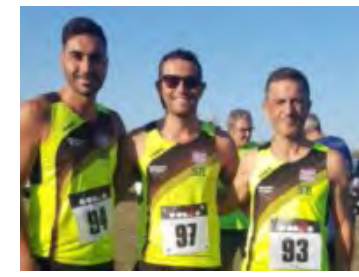
UN TERZETTO RUNNING MODICA A NOTO