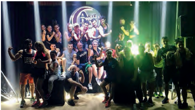
ALCUNI DEI PARTECIPANTI ALL'OPEN DAY DI ARTE DANZA & FITNESS