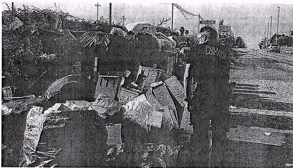
Polizia locale. Vigile urbano durante un controllo per smascherare coloro che non rispettano le regole sul conferimento dei rifiuti

to anche dall'interpretazione del termine conferimento che ha fatto temere che i giorni della raccolta fossero mutati. Alcuni hanno equivocato tra i termini conferimento e raccolta che, ovviamente, individuano due azioni diverse, in giorni diversi facendo sorgere l'equivoco: si conferisce nel giorno precedente la raccolta. Il vice-prefetto Giancarlo Dionisi ha voluto chiarire come stanno le cose: l'ordinanza non è immediatamente operativa e ci sarà primo un periodo di informazione alla città. «Abbiamo emanato l'ordinanza - spie-