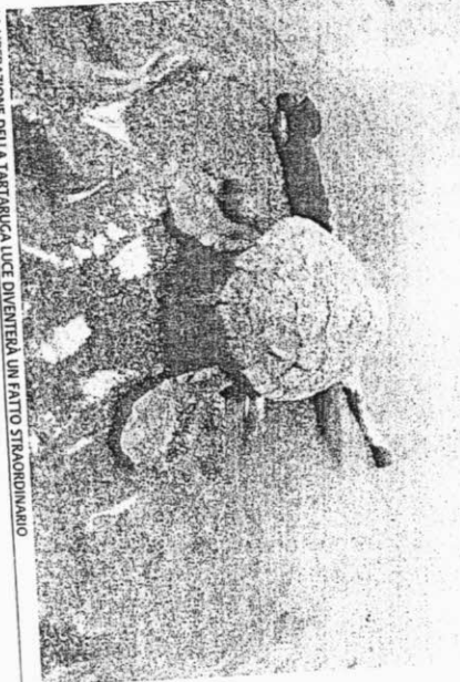
LA LIBERAZIONE DELLA TARTARUGA LUCE DIVENTRÒ UN FATTO STORICO