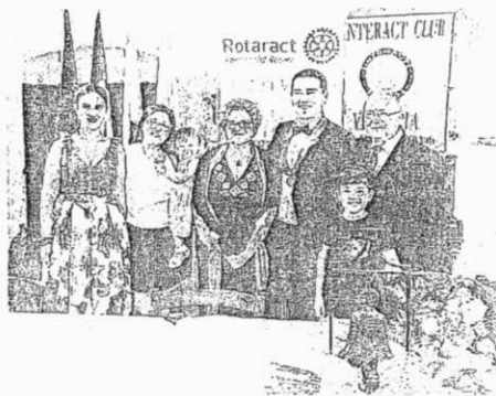
IL PASSAGGIO DELLE CONSEGNE AL ROTARACT

Inevitabile è stata la commozione nell'ascoltare la presidente uscente ripercorrere i suoi due anni di mandato rotaractiano definendo la missione del club "intrisa dello stesso coraggio che occorre avere nell'affrontare la vita stessa".