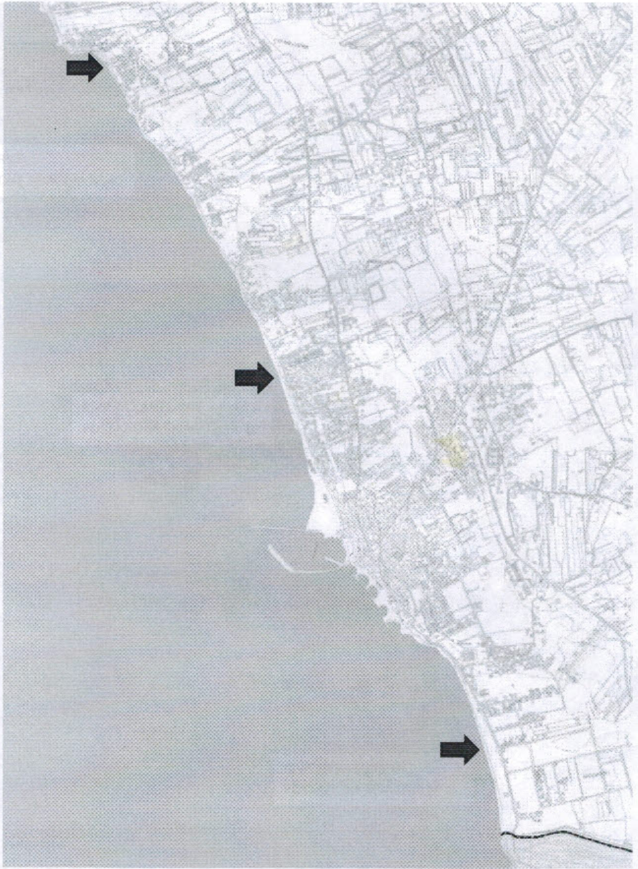
Aerofotogrammetria di Scoglitti con indicate le postazioni "assistenti bagnanti" Estate 2018