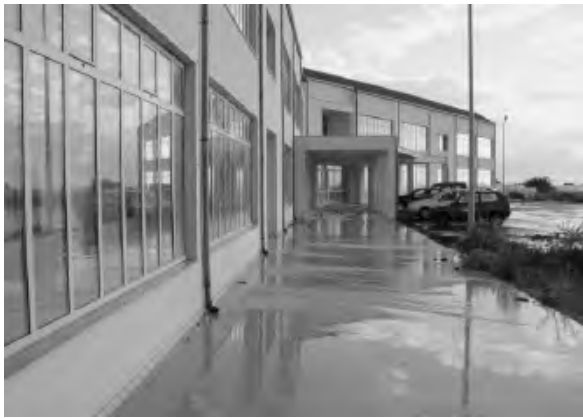
IL CENTRO DI RICERCA APPLICATA IN AGRICOLTURA