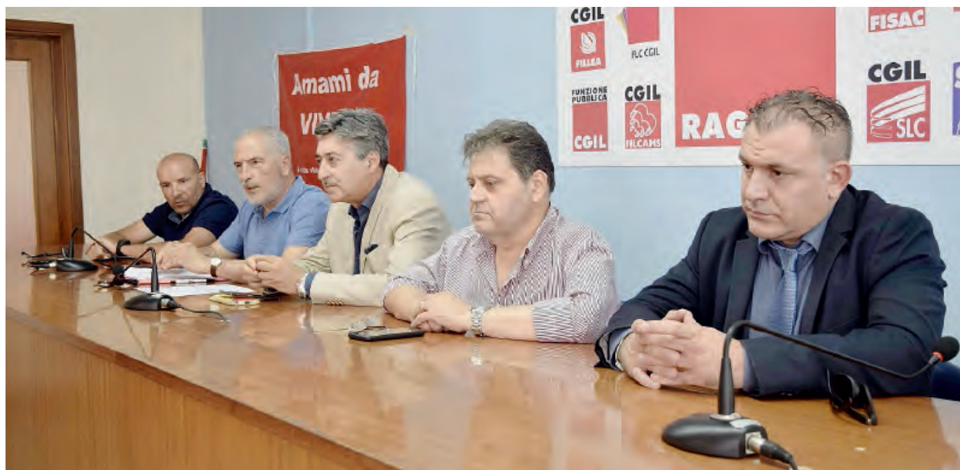
La conferenza stampa tenutasi ieri mattina nella sede della Camera del lavoro di vico Cairoli.

“I servizi sanitari devono funzionare al meglio – hanno detto i sindacalisti – il personale che c'è non è sufficiente. Il direttore generale dirama degli ordini di servizio per mobilità di personale di trasferimento da una struttura a un'altra senza che noi siamo informati e senza tenere conto di un regolamento interno che esiste da tempo. Fino a stamattina abbiamo rilevato come la Rsa di Comiso che è