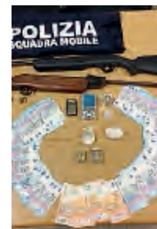
Le armi, la droga e i soldi sequestrati dalla Mobile