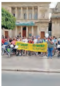
CICLISMO A VITTORIA