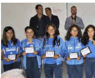
UN GRUPPO RAGAZZE NO AL DOPING