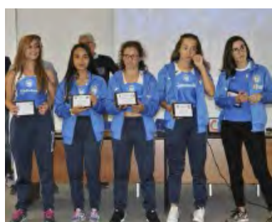
GRUPPO CADETTE NO AL DOPING