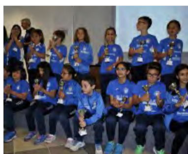
GRUPPO ESORDIENTI NO DOPING

Dopo queste prime cinque prove, battaglia apertissima in quasi tutte le categorie, in un Gp che ha già visto la partecipazione record di oltre 90 giovanissimi talenti delle categorie esor-