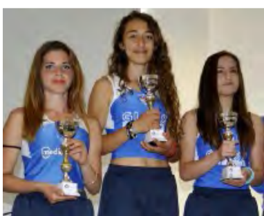
TRE ALLIEVE DELLA NO AL DOPING