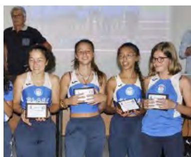
UN GRUPPO RAGAZZE NO AL DOPING