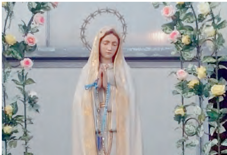
IL SIMULACRO DELLA MADONNA DI FATIMA NELLA CHIESA DELLO SPIRITO SANTO