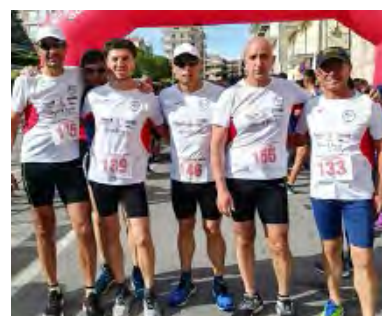
ULTRARUNNING ALLA S. DOMENICO SAVIO