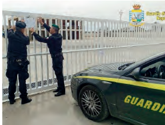
Nel mirino della Guardia di finanza un imprenditore che opera nel settore degli imballaggi agricoli

Gli investigatori del Nucleo di Polizia Economico-Finanziaria di Ragusa, nel corso di una specifica attività delegata dalla locale Procura della Repubblica, hanno individuato e sottoposto a sequestro beni immobili e quote sociali per un valore di circa un milione di euro che era nella disponibilità del presunto responsabile del reato. Valutata la gravità del reato fiscale, il gip di Ragusa ha accolto la richiesta avanzata dalla Procura della Repubblica a se-