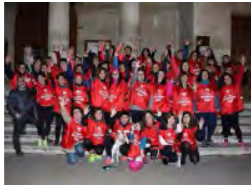
FOTO DI GRUPPO PRIMA DEL VIA