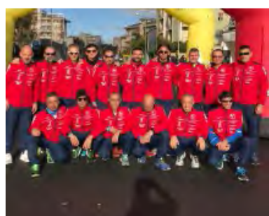
ULTRARUNNING ALLA MARATONA DI RAGUSA