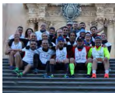
ULTRARUNNING...E IL BAROCCO IBLEO