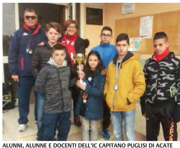
ALUNNI, ALUNNE E DOCENTI DELL'IC CAPITANO PUGLISI DI ACATE