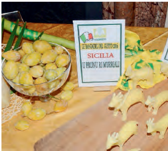
PIÙ PROMOZIONE E SOSTEGNO ALLE PRODUZIONI DEI PICCOLI COMUNI

PALERMO. Il mondo agricolo siciliano continua la sua battaglia per dare ossigeno alle produzioni e alle imprese. Così se da un lato c'è la massima attenzione sul problema legato alla siccità e alla cronica mancanza da utilizzare per irrigare i campi, su altri fronti si cerca di sostenere battaglie che siano realmente finalizzate al sostegno del comparto, evitando di seminare illusioni che portano, poi, a raccogliere solo altre delusioni.