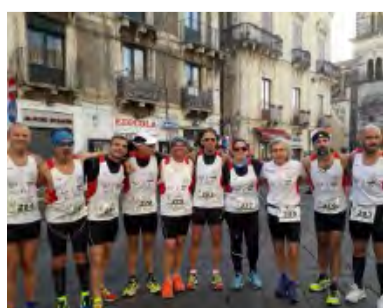
ULTRARUNNING RAGUSA AD ACIREALE