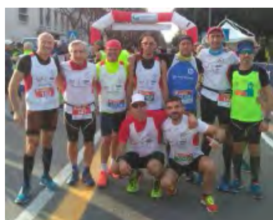
ULTRARUNNING RAGUSA A MESSINA