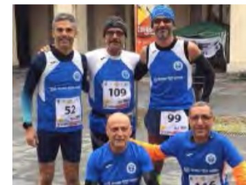
IL GRUPPO NO AL DOPING