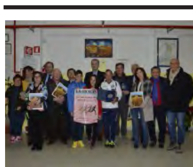
I PREMIATI DEL TOP ATLETICA 2016

Adesso appuntamento il 20 prossimo a Scicli per la grande festa ragusana con il 6° «Top Atletica».