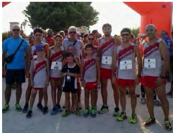
GRUPPO DI ATLETI DELLA LIBERTAS SCICLI CON IL TECNICO RUSCICA