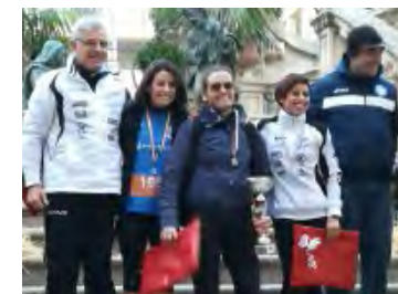
LA PREMIAZIONE DELLA PROVA FEMMINILE