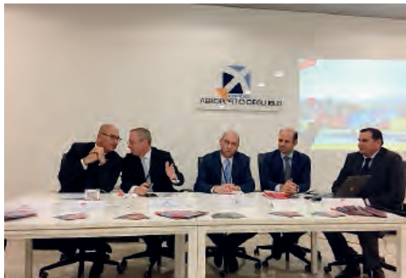
LA PRESENTAZIONE DELLA NUOVA TRATTA