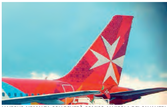
L'AIRBUS AIRMALTA COLLEGERÀ COMISO ALL'ISOLA DEI CAVALIERI