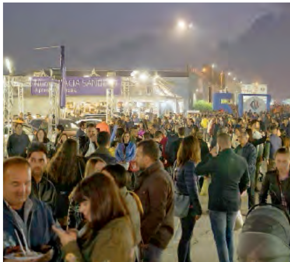
Grande affluenza di pubblico alla Campionaria d'Autunno 2017

“Il futuro - sottolinea il sindaco di Vittoria - è fatto di serietà e di credibile pragmatismo. Siamo qui per questo e Vittoria Mercati è stata investita del ruolo di ente gestore proprio per le capacità che riconosciamo alle figure che la compongono di riorganizzare l'Ente Fiera”. Come Vittoria Mercati - chiarisce il presidente