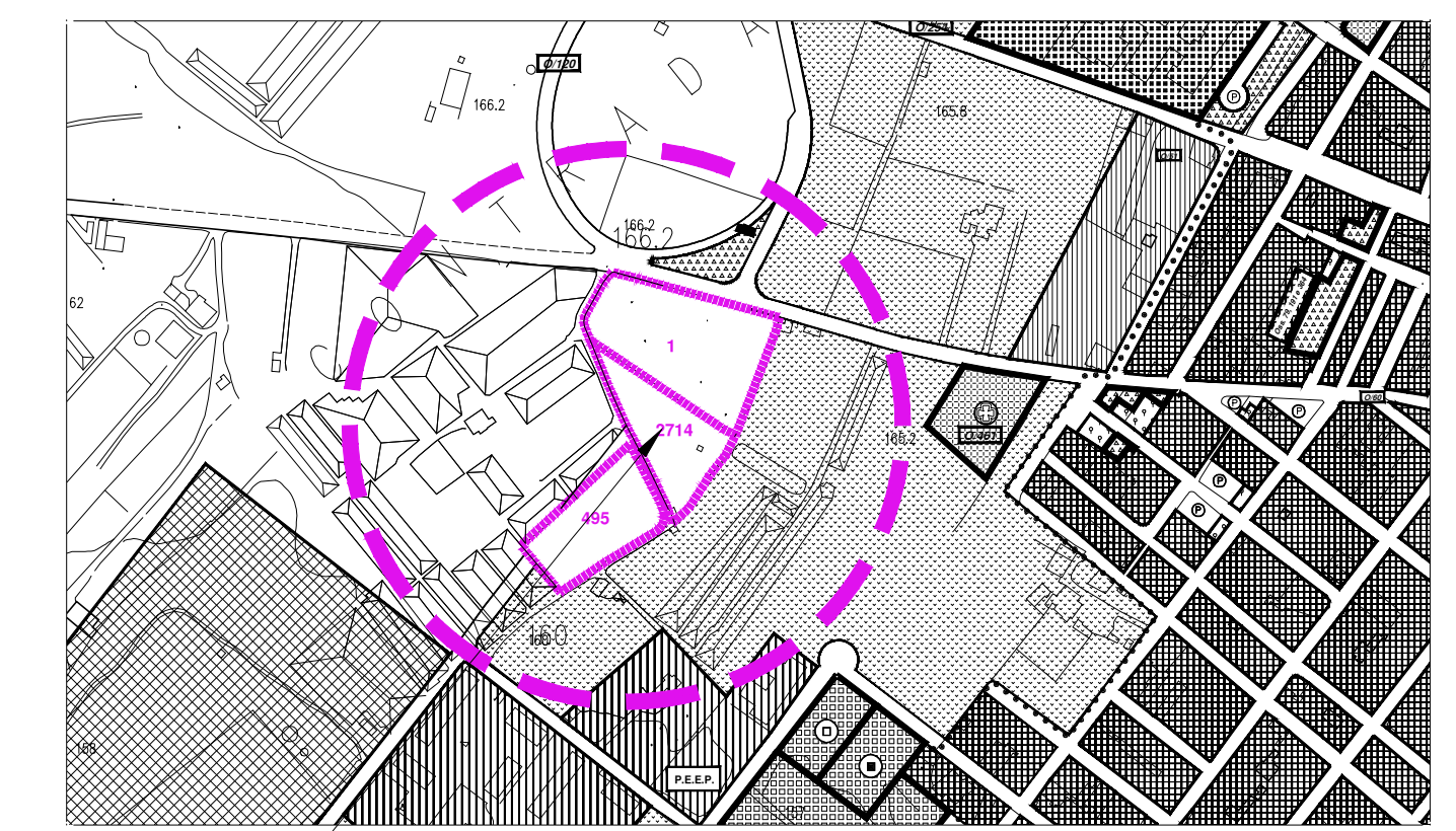
NUOVA DESTINAZIONE AREA IN VARIANTE ZONA "E" (F.104 PART.1-2714 E F.103 PART.495)

IL PROGETTISTA Arch. SALVATORE LOREFICE IL DIRIGENTE