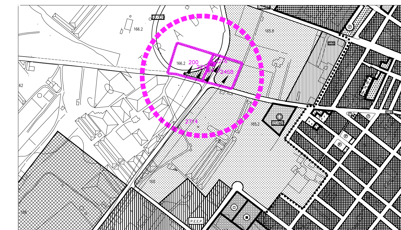
AREA OGGETTO DI VARIANTE (F.86 PARTT.200-2216-2217-2457-2458)