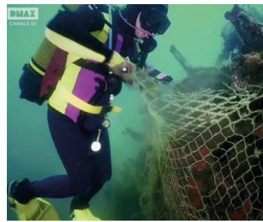
CACCIATORI DI RETI FANTASMA Serie televisiva (DMAX) prodotta da Sunrise Film Production Milano regia di Christian Gandini