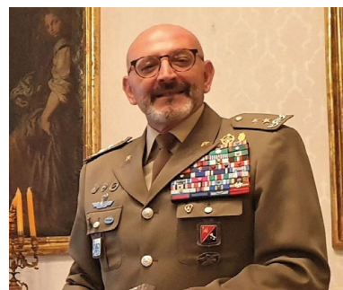
MAURIZIO SCARDINO Comandante Militare dell'Esercito in Sicilia