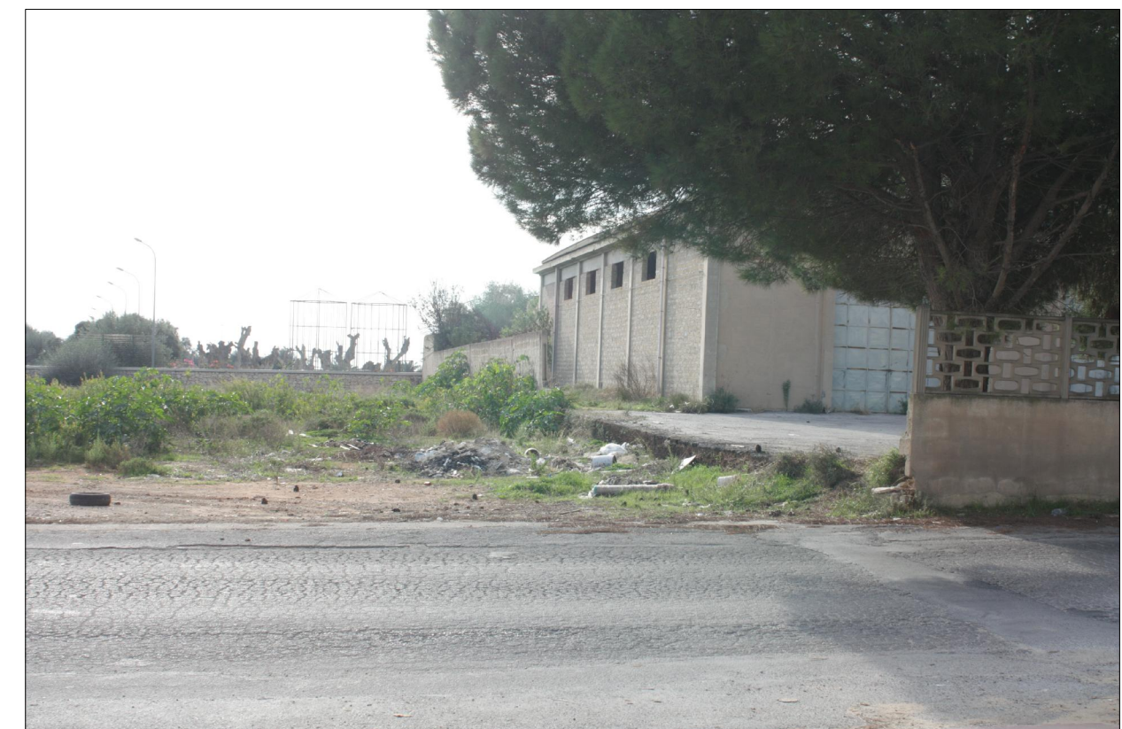
Vista n° 2