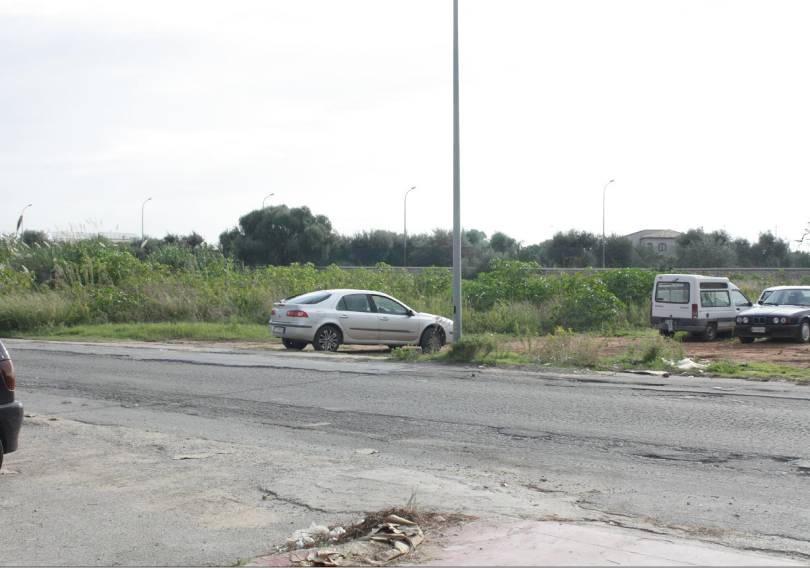
Vista n° 3