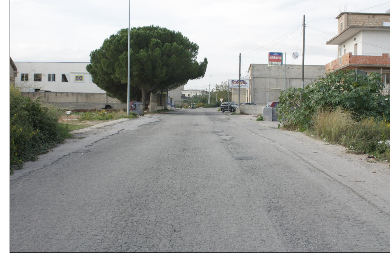
Vista n° 5