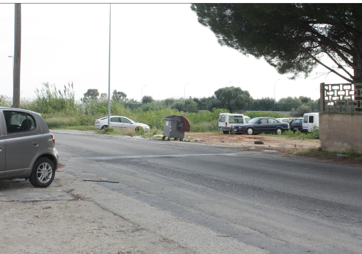
Vista n° 4