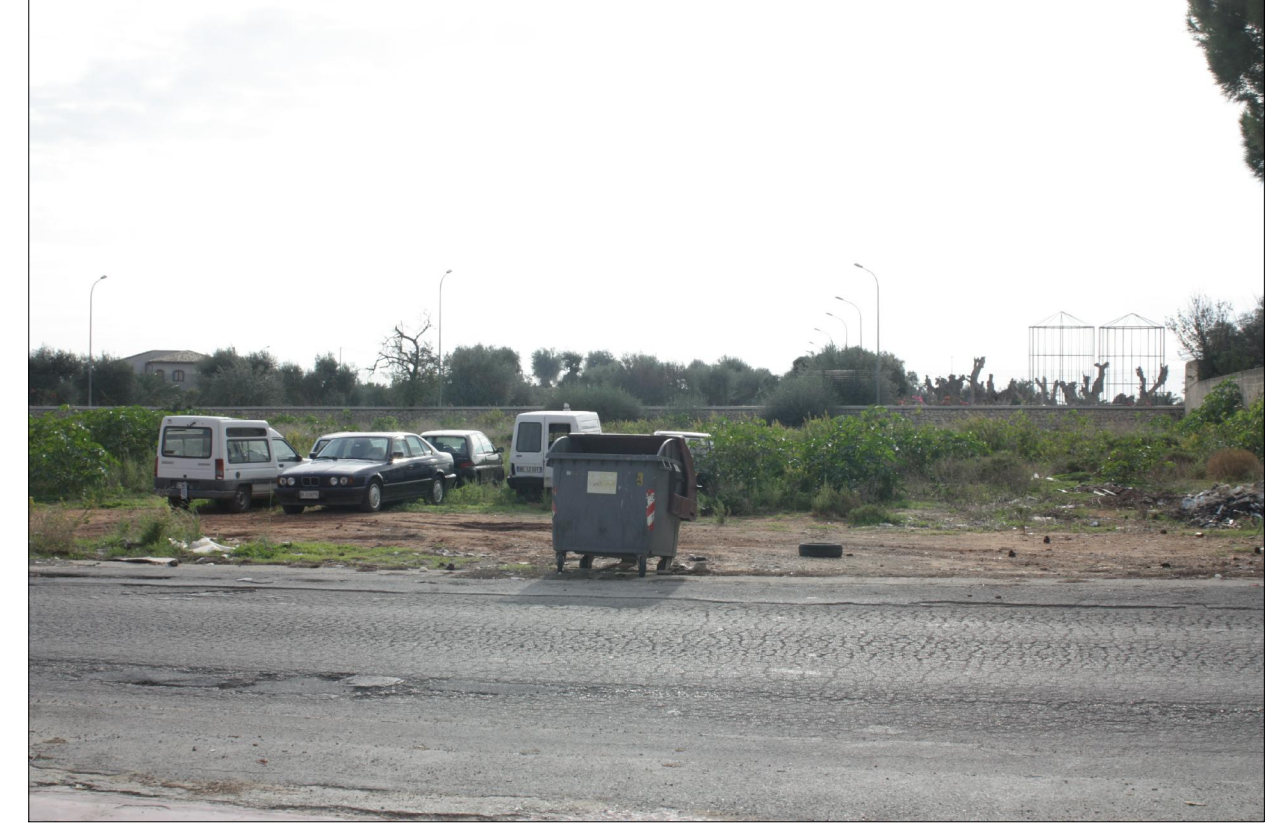
Vista n° 1