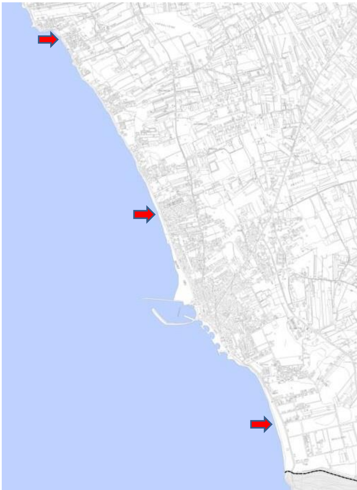
Aerofotogrammetria di Scoglitti con indicate le postazioni “assistenti bagnanti” Estate 2021