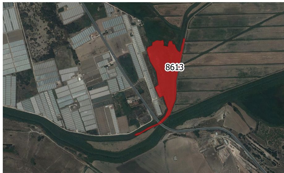
LOCALIZZAZIONE INCENDIO - Scala 1:10.000