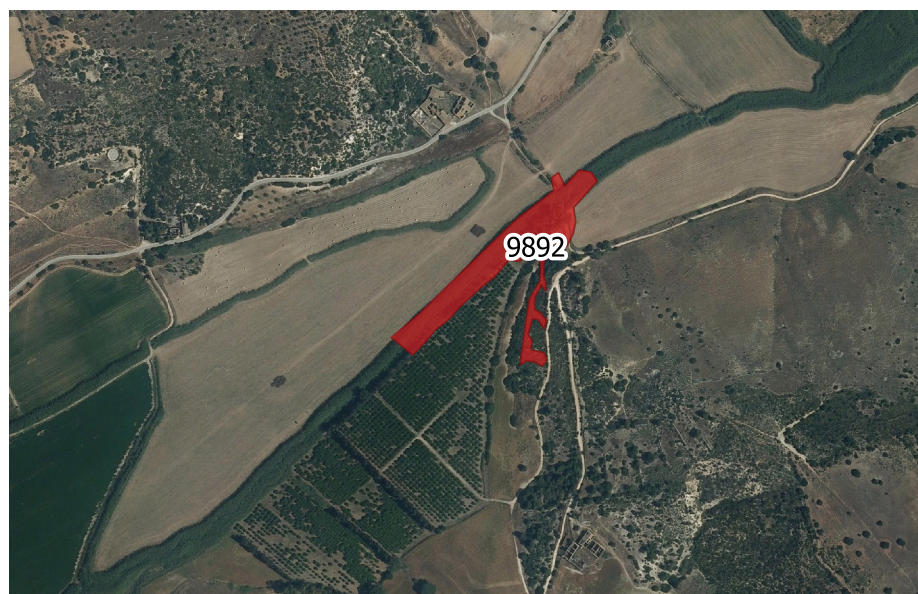
LOCALIZZAZIONE INCENDIO - Scala 1:10.000