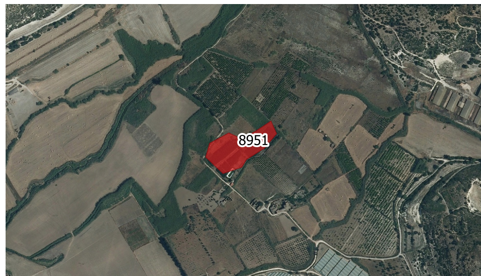
LOCALIZZAZIONE INCENDIO - Scala 1:10.000