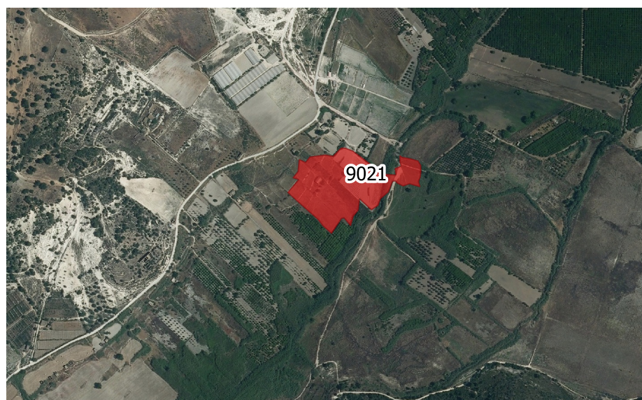
LOCALIZZAZIONE INCENDIO - Scala 1:10.000