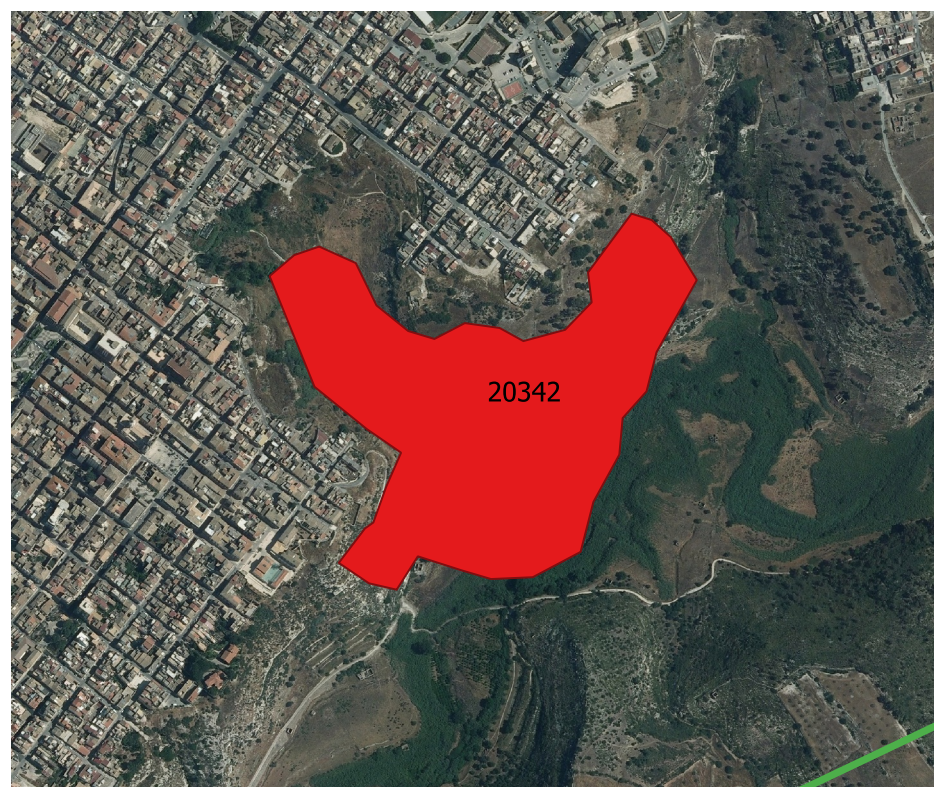
Localizzazione incendio - Scala 1:10000