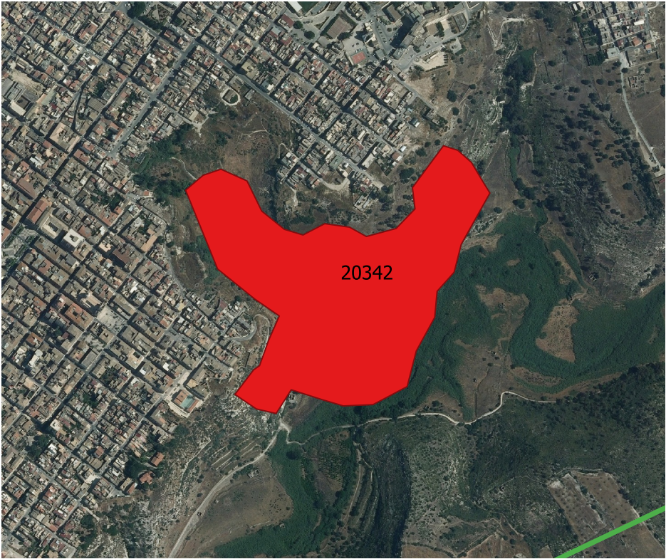
Localizzazione incendio - Scala 1:10000