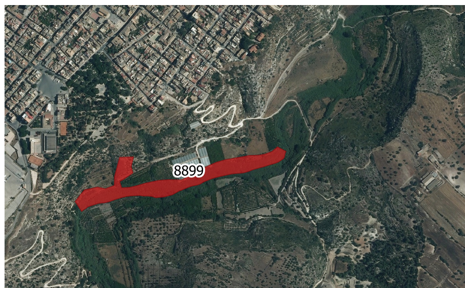
LOCALIZZAZIONE INCENDIO - Scala 1:10.000