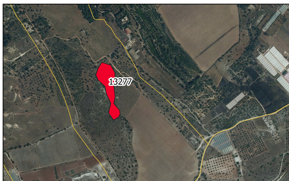
LOCALIZZAZIONE INCENDIO - Scala 1:10.000