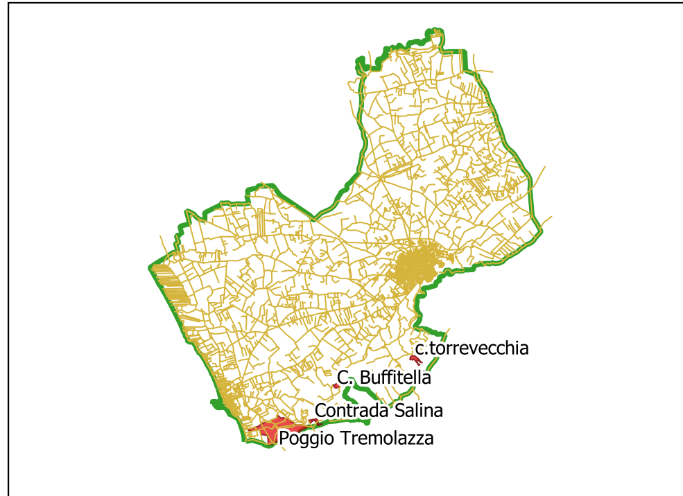
LOCALIZZAZIONE INCENDI - Scala 1:250.000