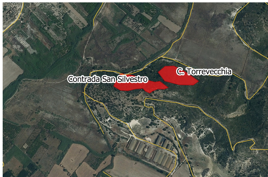
LOCALIZZAZIONE INCENDIO - Scala 1:10.000