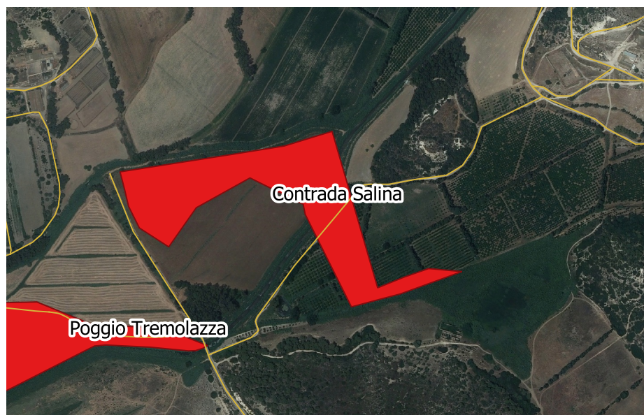
LOCALIZZAZIONE INCENDIO - Scala 1:10.000