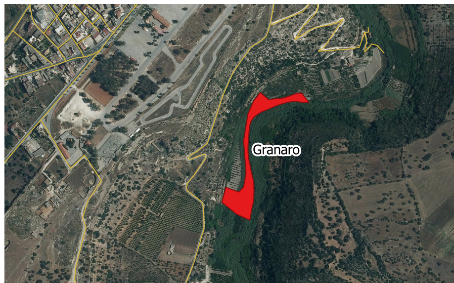
LOCALIZZAZIONE INCENDIO - Scala 1:10.000