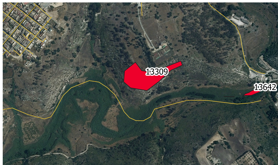
LOCALIZZAZIONE INCENDIO - Scala 1:10.000