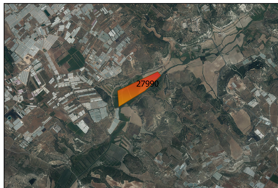
LOCALIZZAZIONE INCENDIO - Scala 1:50.000