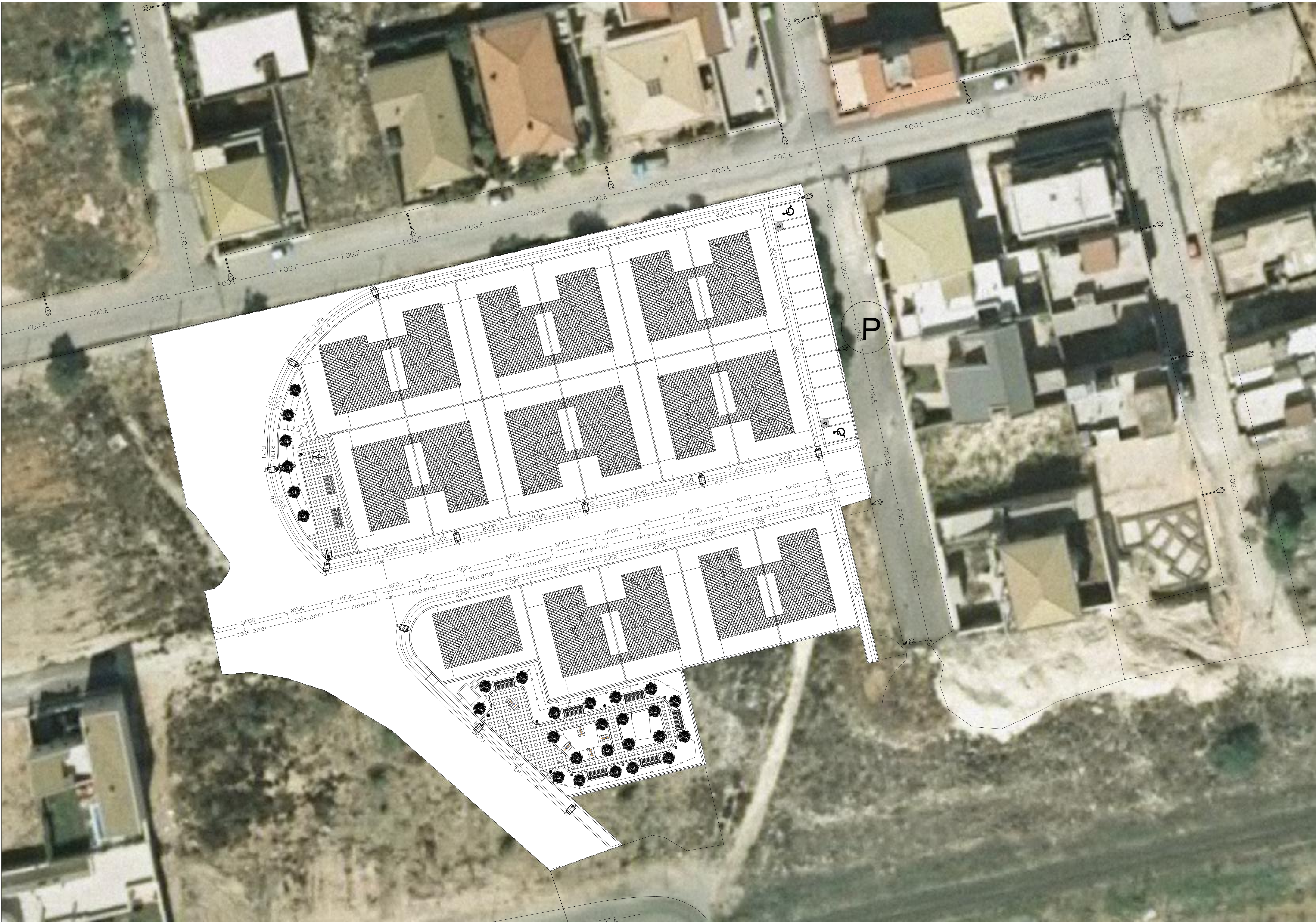
PLANIMETRIA SU ORTOFOTO CTR CON L'INDIVIDUAZIONE DEI LOTTI - DEI CORPI DI FABBRICA E E DELLE OPERE DI URBANIZZAZIONE DA REALIZZARE SCALA 1:250

Progetto: Revisioni: 1 Revisioni: 2 Revisioni: 3