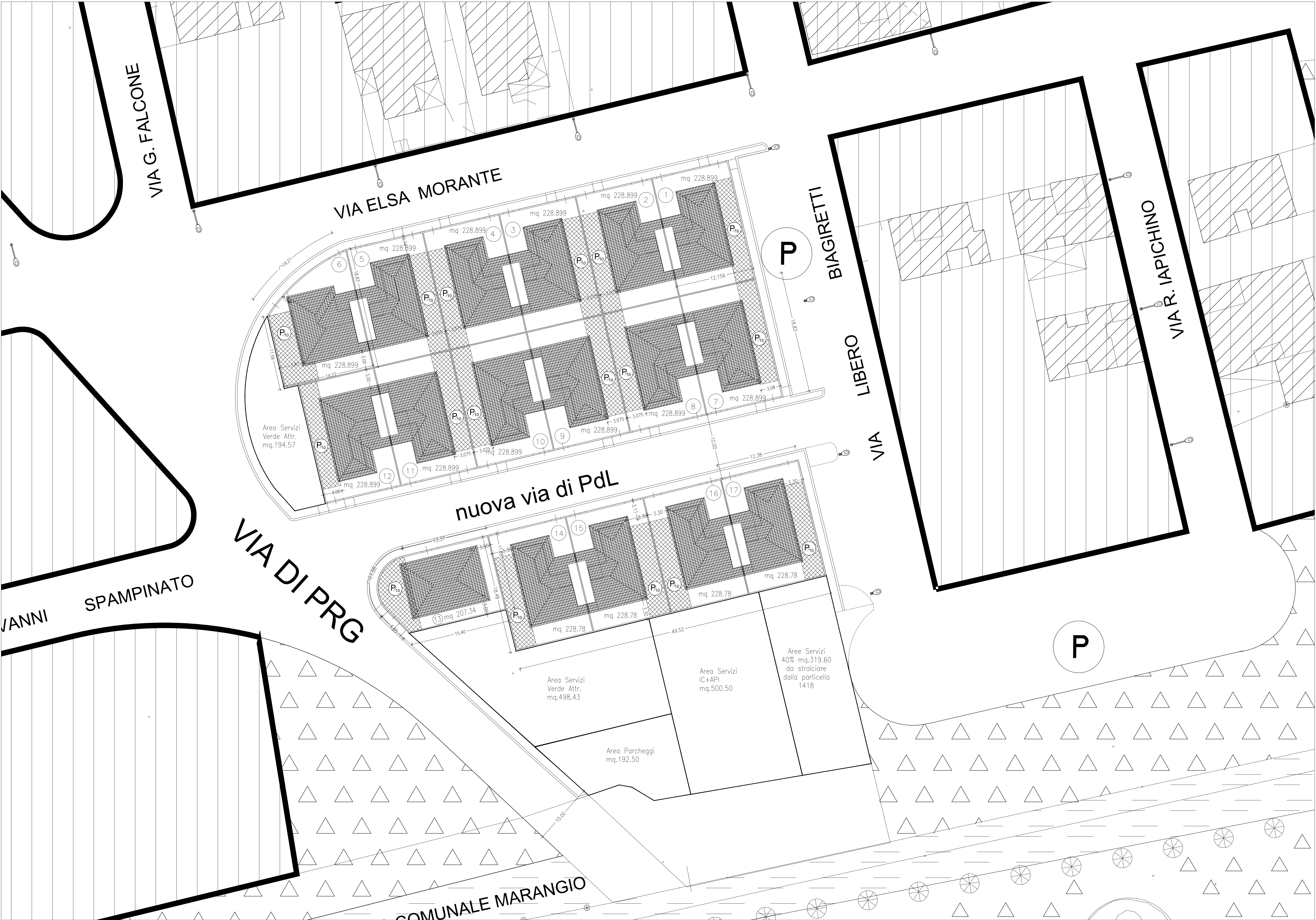
PLANIMETRIA SU STRALCIO TAV.04 P.E. DEL PRG CON L'INDIVIDUAZIONE DEI LOTTI - DEI CORPI DI FABBRICA E DEI PARCHEGGI INTERNI AI LOTTI SCALA 1:250