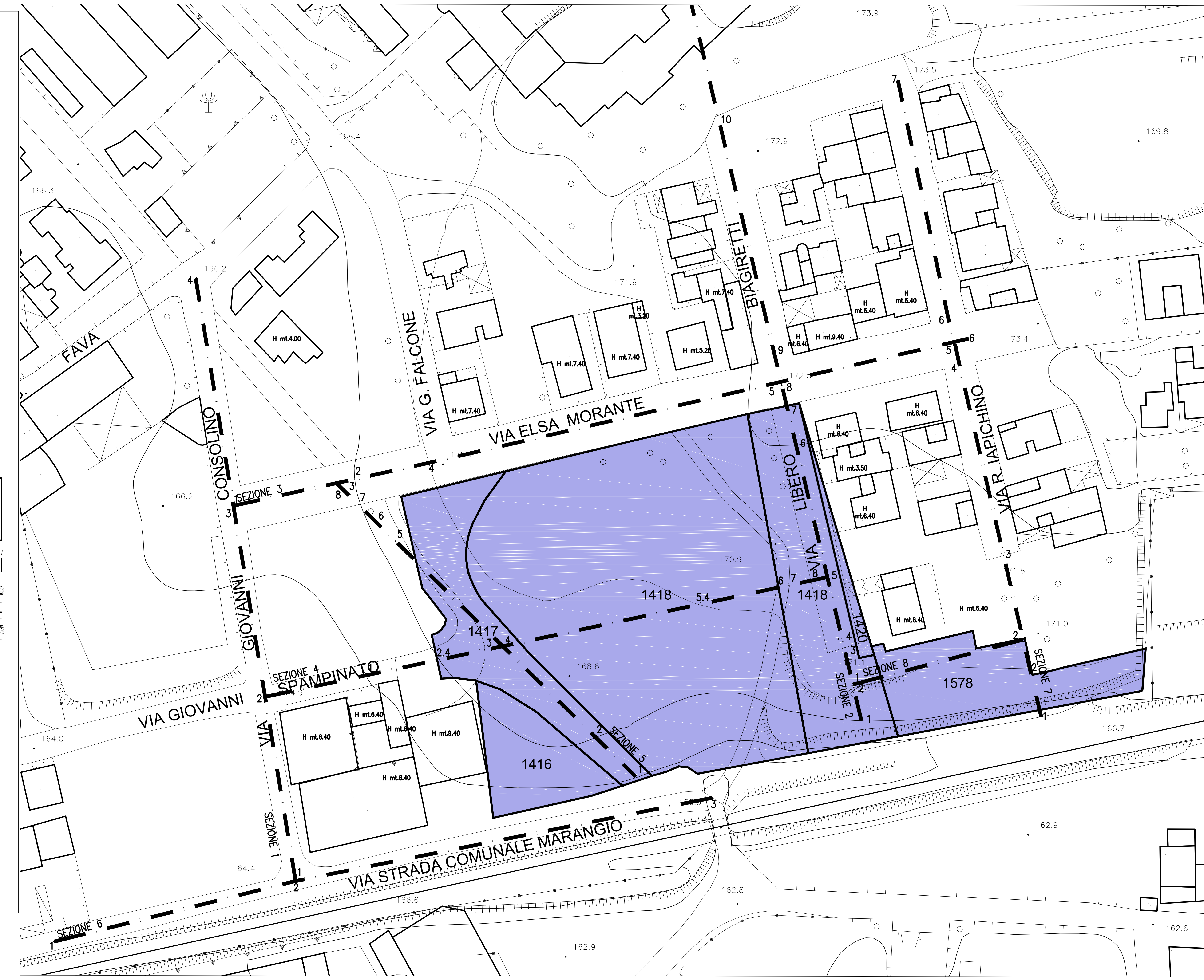
PLANIMETRIA SU CTR CON INDICATE LE ALTEZZE DEGLI EDIFICI SU PIANO QUOTATO CON L'INDICAZIONE DELLE LINEE DI SEZIONE DELLE STRADE ESISTENTI SCALA 1:500