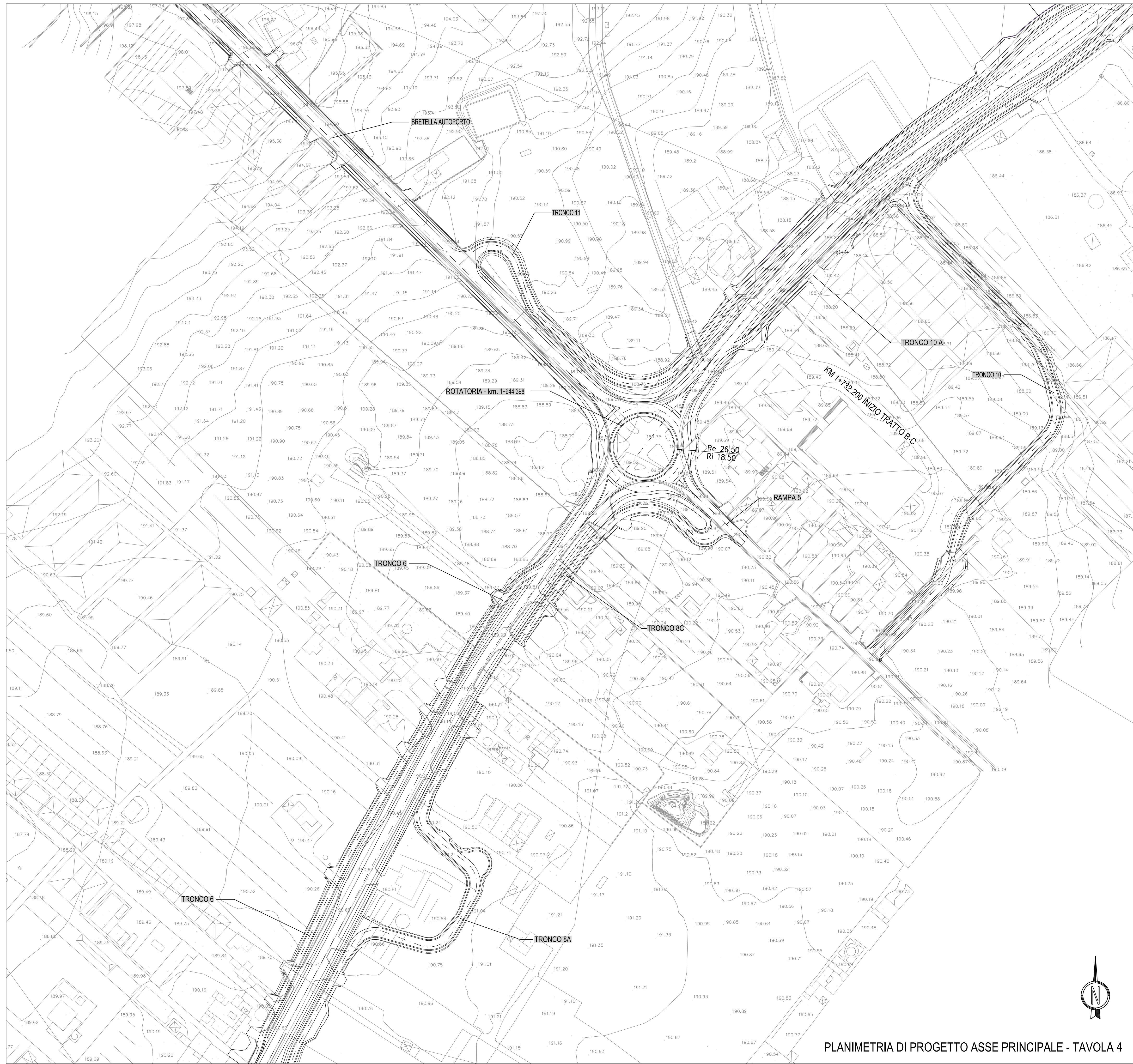
PLANIMETRIA DI PROGETTO ASSE PRINCIPALE - TAVOLA 4