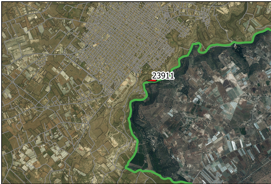
LOCALIZZAZIONE INCENDIO - Scala 1:50000