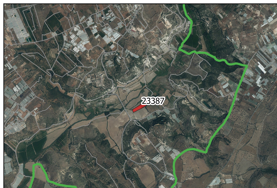
LOCALIZZAZIONE INCENDIO - Scala 1:50000