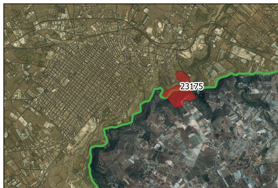
LOCALIZZAZIONE INCENDIO - Scala 1:50000