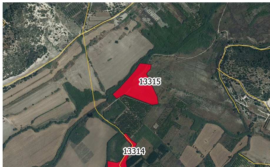
LOCALIZZAZIONE INCENDIO - Scala 1:10.000