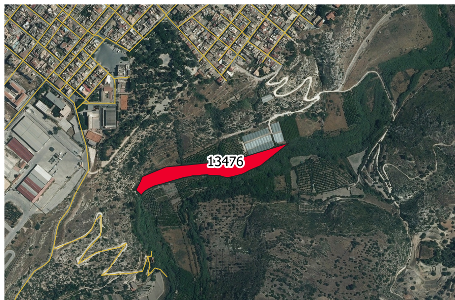
LOCALIZZAZIONE INCENDIO - Scala 1:10.000