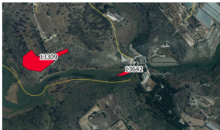
LOCALIZZAZIONE INCENDIO - Scala 1:10.000