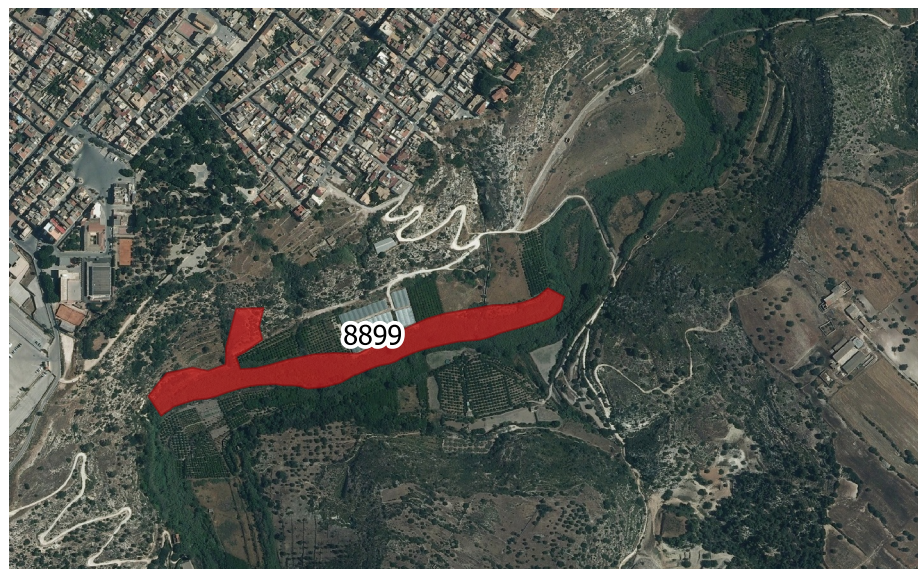
LOCALIZZAZIONE INCENDIO - Scala 1:10.000