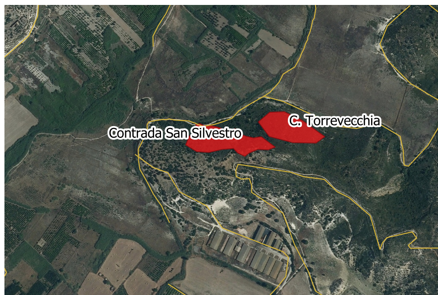
LOCALIZZAZIONE INCENDIO - Scala 1:10.000