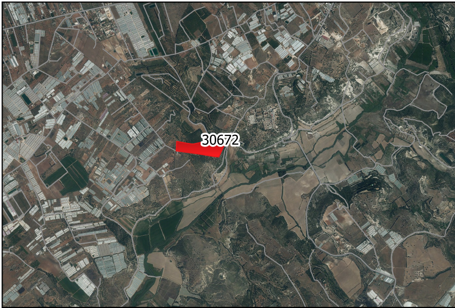
LOCALIZZAZIONE INCENDIO - Scala 1:50.000