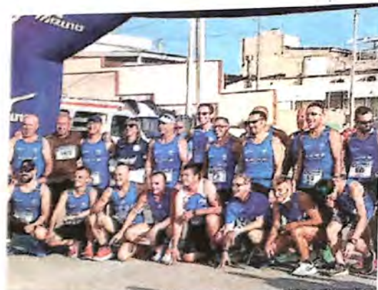
La No al Doping Ragusa a Scoglitti