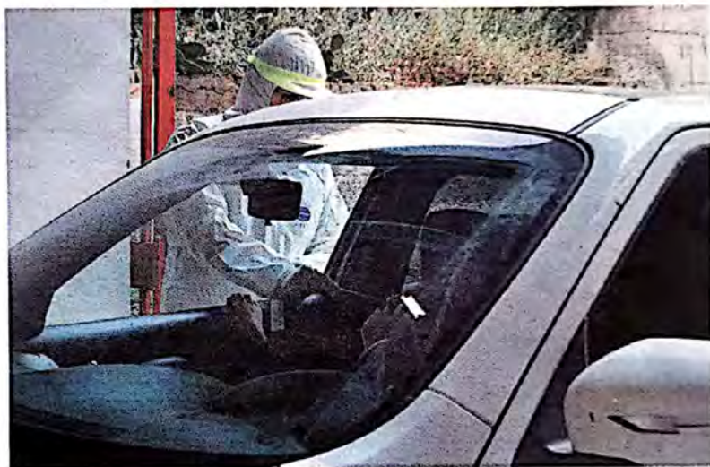
Controlli. E' ripresa l'attività dei drive-in per la verifica dei cittadini con i tamponi rapidi. Sotto, il quadro diramato dall'Asp e relativo alla giornata di martedì scorso.

Oggi, giovedì, 29 luglio, sarà il turno delle verifiche a Ispica, dalle 18 alle 20 presso la sede della Protezione Civile. Venerdì 30 luglio sarà data la possibilità ai residenti delle zone bal-