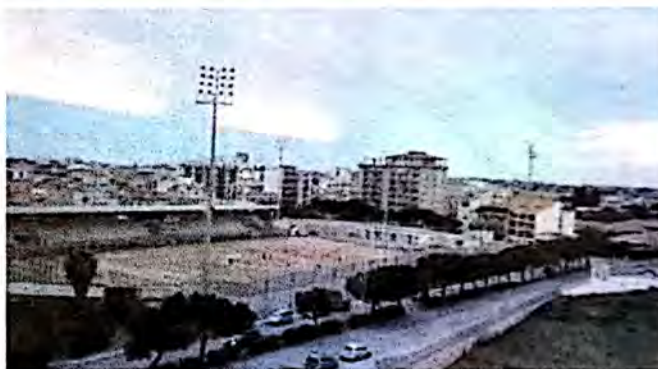
Le attuali condizioni dello stadio comunale di Vittoria

Secondo i calcoli di La Mattina per rendere dignitosamente calpestabili gli stadi di Vittoria e Scoglitti serve un mutuo di 800 mila euro. E poi? "Non deve essere mai più dato in affidamento alle società dei vari impianti, perché è un insuccesso, a parte il campo Emaia, ma l'Ente deve mantenere la gestione affidandola a custodi comunali come un tempo".