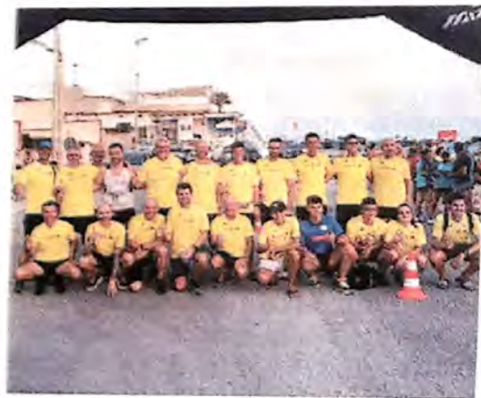
La Running Modica a Scoglitti