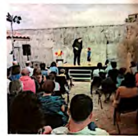
Esibizioni. a sinistra Out, compagnia Unterwasser e, sopra, Dado show.