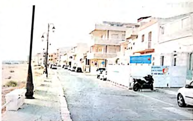
Nuove scelte. Da oggi attive le strisce blu a Scoglitti (nella foto sopra il lungomare) con l'obiettivo di mettere fine alla sosta selvaggia. Nella foto sotto, il lungomare di Donnalucata. Nella borgata è attiva in orario antimeridiano la Zona a traffico limitato.

Per risparmiare qualcosa si può fare l'abbonamento mensile di 70 euro iva compresa. La disposizione del Comune prevede agevolazioni tariffarie per gli abbonamenti che possono essere rilasciati a titolari di attività produttive (commercianti, artigiani e professionisti).