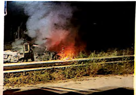
Alcuni degli incendi, in particolare nella riserva del Pino d'Aleppo, domati nelle ultime ore dai vigili del fuoco iblei